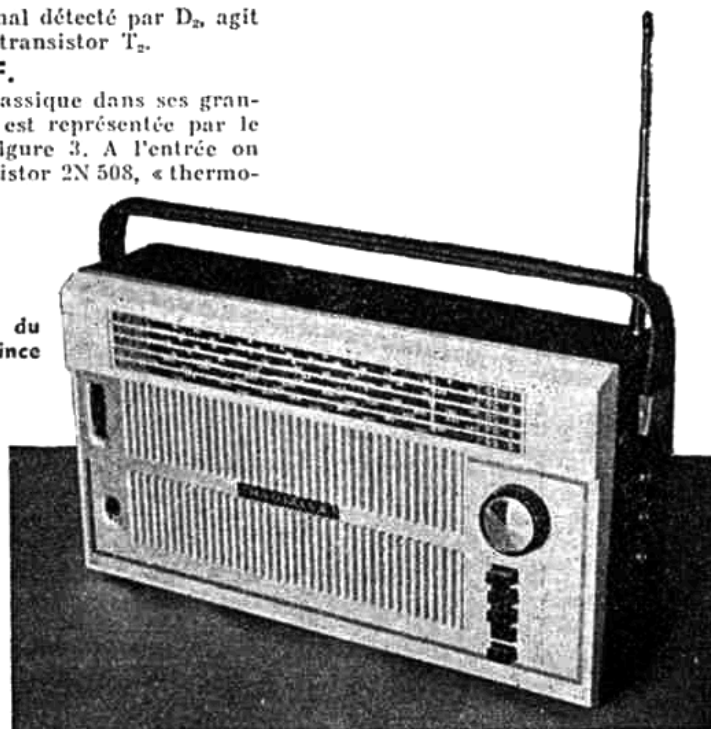
Aspect extérieur du portable « Prince Export »

Tout à fait classique dans ses grandes lignes, elle est représentée par le schéma de la figure 3. A l'entrée on trouve un transistor 2N 508, « thermo-