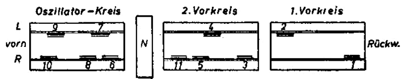
Wellenschalter (von unten gesehen)