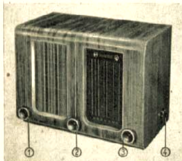
① Lautstärkeregl. mit Netzschalter, ② Tonblende mit Bandbreitenregelung, ③ Abstimmung, ④ Wellenbereichsschalter

HERSTELLER: BLAUPUNKT-WERKE GMBH., BERLIN, DARMSTADT, HILDESHEIM