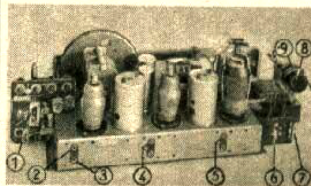
① Wellenbereichsschalter, ② Antennenanschluß, ③ Erdanschluß, ④ Tonabnehmeranschluß, ⑤ Anschluß für zweiten Lautsprecher, ⑥ Spannungswähler, ⑦ Sicherung 0,6 A, ⑧ Lautstärkereglern mit Netzschalter, ⑨ Klangblende