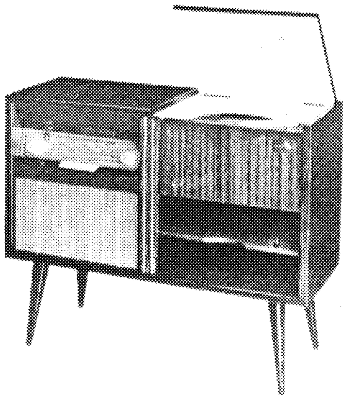
L. 96.600 mobile in legno

Gamme d'onda: AM n. 2 - medie - corte FM. Valvole: n. 6 - tipi: ECC85 - ECH81 - EF89 - EABC80 - EL84 - EZ81. Funzioni di valvole: n. 13. Indicatore di sintonia: EM81. Altoparlanti: n. 2 magnetodinamici - diametro 215 mm - diametro 155 x 100 mm (ellittico). Commutatore di gamma: a tastiera. Regolatore di tonalità: singolo - a rotazione. Antenna: AM incorporata fissa - FM presa a 75 - 300 ohm e incorporata. Presa fonografica. Giradischi: normale con 4 velocità. Testina rilevatrice: piezoelettrica. Potenza d'uscita: 3,5 W ca. Alimentazione: ca 110 - 220 V - 60 W. Dimensioni: cm 79 x 66 x 32. Peso: kg 19 ca.