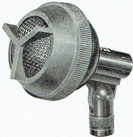
VU DE FACE