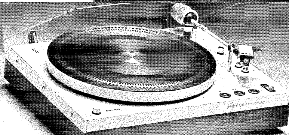
GA 212 électronique manuelle. Moteur à induction, asservissement tachymétrique, cellule "Super M" GP 400. Prix : 1140 F*