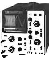
D 67 A