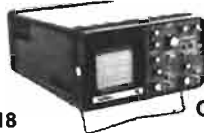
OX 712 A

NOUS ACCEPTONS LES BONS DE COMMANDE DES ÉCOLES, UNIVERSITÉS, MAIRIES et TOUTES ADMINISTRATIONS POSSIBILITÉS DE CRÉDIT (CREG et CETELEM) de 3 à 21 mois selon désir et réglementation en vigueur. VENTE PAR CORRESPONDANCE FRANCE et ÉTRANGER (détaxe)