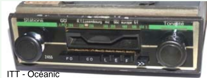
ITT - Océanic