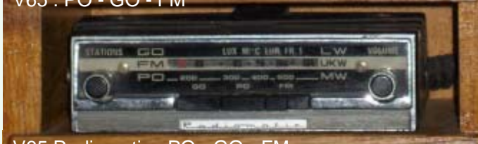
V65 Radiomatic : PO - GO - FM