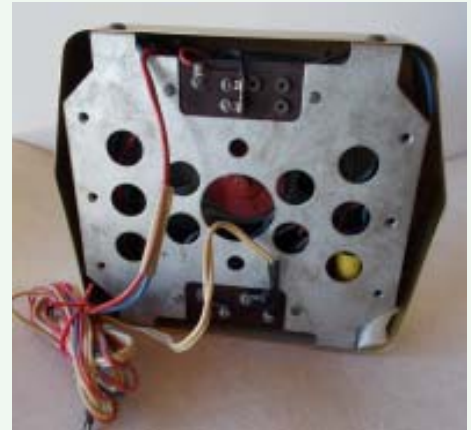
Amplatron : HP ampli «booster» voiture pour Ultron