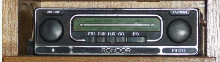
Pilote Rondor : PO - GO - présélections