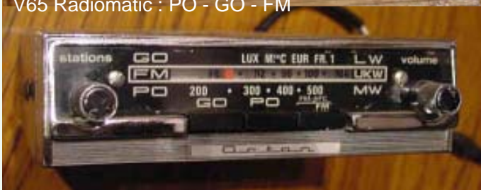
V65 Octon : PO - GO - FM