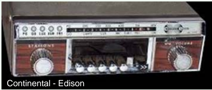
Continental - Edison