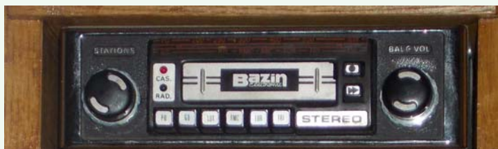
Bazin : PO - GO - FM - présélections - stéréo