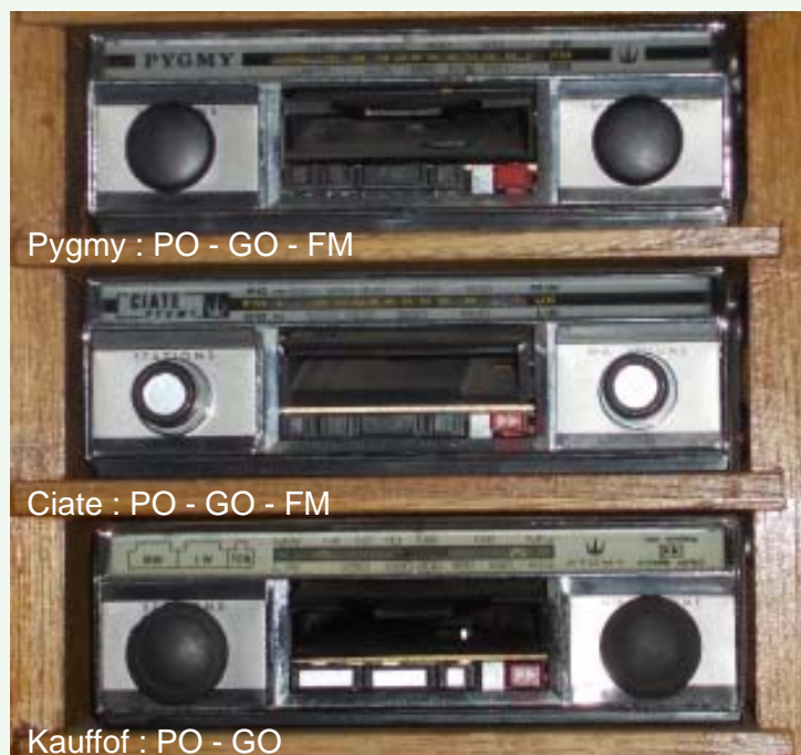
Pygmy : PO - GO - FM