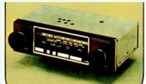
VT 22 : PO - GO - présélections