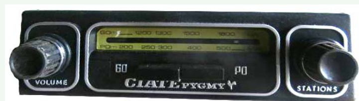
Start (époque Ciate-Pygmy) : PO - GO