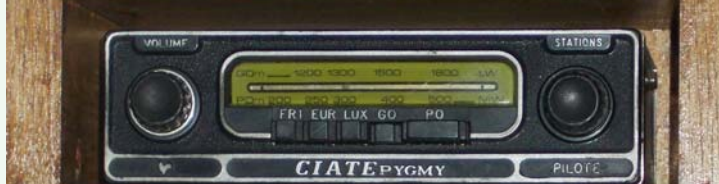
Pilote Ciate : PO - GO - présélections