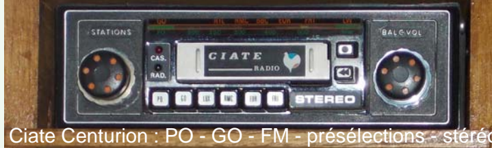
Ciate Centurion : PO - GO - FM - présélections - stéréo