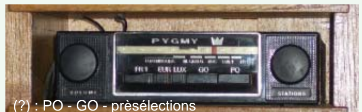
(?) : PO - GO - présélections