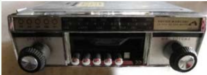
Pathé - Marconi