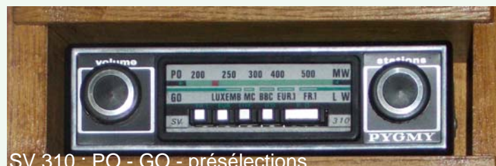
SV 310 : PO - GO - présélections