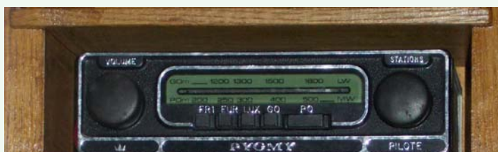
Pilote : PO - GO - présélections