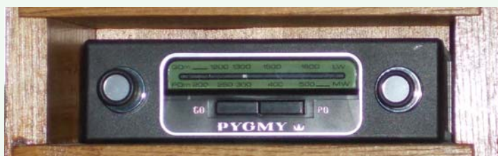
Start : PO - GO