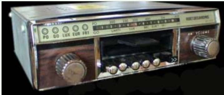
Ribet - Desjardins