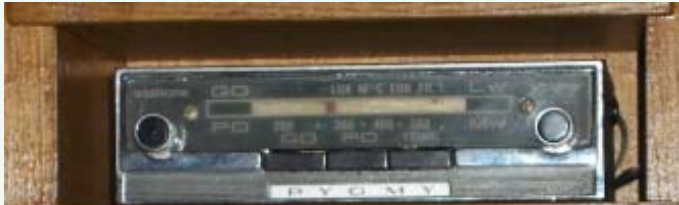
V31 : PO - GO