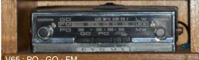
V65 : PO - GO - FM