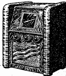
SELECT METAL 5 lampes métalliques 495 fr.