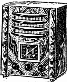
N° 4 4 lampes américaines 425 fr.

Agences en province : MARSEILLE, 25, rue Nationale • BORDEAUX, 17, cours Victor-Hugo • LYON, 80 cours Lafayette • LILLE, 24, rue du Sec-Arembaut TOURS, 97, av. de Grammont • NICE, 28, rue de Paris • TOULOUSE, 6, rue du Poids-de-l'Huile.