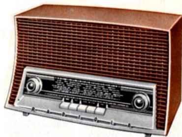
RA 369 AM/FM

5 lampes, 2 diodes germanium. Alt. 115, 127, 220 V. 50 P. H.-P. de 13 cm. GO-PO-FM. Réglage de tonalité à double action sur graves, aiguës et PU. Prises PU et Modulation. Cadre PO/GO. Antenne fil pour F.M. Prises antenne et terre. Emplacement pour adaptateur chalutier. Clavier 5 touches. Coffret bakélite, façade polystyrène, 2 exécutions : Bordeaux façade gris clair, Ivoire façade Corail. 360×220×192.