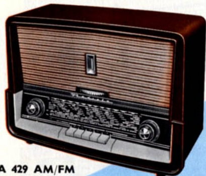
RA 429 AM/FM

5 lampes, 2 diodes germanium. Alt. 115, 127, 220 V. 50 P. H.-P. de 13 cm. GO-PO-FM. Réglage de tonalité à double action sur graves, aiguës et PU. Prises PU et Modulation. Cadre PO/GO. Antenne fil pour F.M. Prises antenne et terre. Emplacement pour adaptateur chalutier. Clavier 5 touches. Coffret bakélite, façade polystyrène, 2 exécutions : Bordeaux façade gris clair, Ivoire façade Corail. 360×220×192.