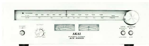
AT-2200 Silver panel model Modèle de panneau argent Silberne Paneelsmodell