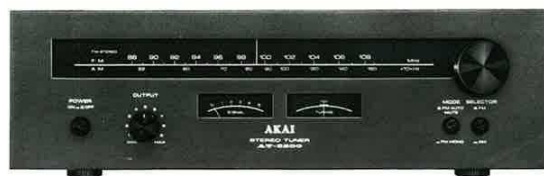
AT-2200 Black panel model Modèle de panneau noir Schwarzem Paneelsmodell