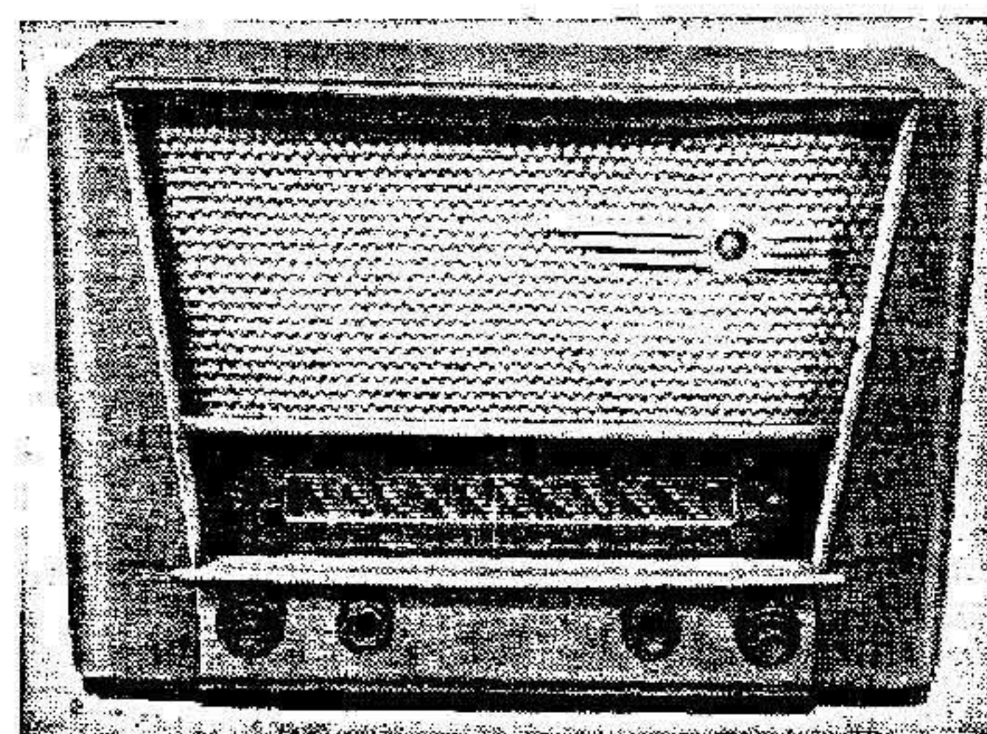
Rozhlasový přijímač 618A „KRIVÁŇ“, výroba 1953 až 1954