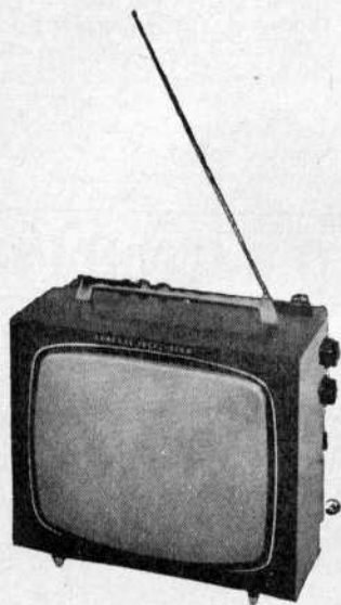
GENERAL TELEVISION Téléviseur portable

Multistandard. Mêmes modèles équipés pour les canaux standards français, belge et luxembourgeois, 819 lignes, français 2° chaîne UHF, belge flamand et CCIR ou OIRT 625 lignes.