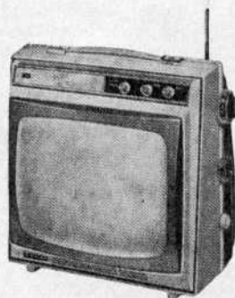
SHARP - Téléviseur portatif à transistors

12 IQ 2. Ecran de 31 cm, angle 110°. Rotacteur 12 positions équipé pour les canaux des standards français, belge, luxembourgeois 819 lignes, belge flamand français 2° chaîne et CCIR 625 lignes. Tuner UHF incorporé. 34 transistors + 22 diodes et 2 valves. Bande passante 8,5 Mc/s. Antenne télescopique. Contrôle automatique de gain. Comparateur de phase. HP 7-12 cm. Alimentation par batterie 12 V ou alternatif 110-220 V, 50 c/s, 36 VA sur secteur, 13 VA sur batterie. Commutation automatique secteur/batterie. Coffret H 340 - L 340 - P 300 mm.