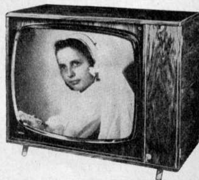
GETOU - Téléviseur de table ou console

Ecran de 50 ou 65 cm. Multicanal, équipé à la demande. Rotacteur 12 positions. Tuner UHF à transistors. Equipé pour les canaux des standards français 819 et 625 lignes. Sensibilité 40 \mu V. 17 tubes + 2 transistors et 3 diodes. Contrôle automatique de gain vision et son. Contrôle automatique de contraste. Correction de qualité d'image. Comparateur de phase adaptable. Puissance 3 W, distorsion 5 %. 2 HP en façade. Prises pour magnétophone et HPS. Alternatif 110-240 V, 50 c/s, 170 VA. Ebénisterie toutes essences. Porte cache-réglages fermant à clé.