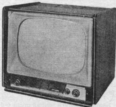
SCHNEIDER - Téléviseur de table

SF1559LD. Tube de 43 cm aluminisé, angle 90°. Concentration électrostatique automatique. Multicanal, multistandard. Rotacteur 12 positions, équipé pour 1 ou plusieurs canaux des standards français, belge et Luxembourg 819 lignes, belge et C.C.I.R. 625 lignes. 22 lampes + 2 redresseurs. Sensibilité image 10 \mu V (*), son 2 \mu V. Commande automatique de contraste (CAC). Commande automatique de volume sonore (CAV). Comparateur de phase (AFC). Double anti-parasites son et image : automatique par écrêtage, et manuel par inversion. 2 HP : 12 cm et 17 cm. Puissance 2,8 W. Correction BF. Prise HPS basse impédance. Alternatif 110/245 V, 50 c/s, 190 VA. Ebénisterie noyer, décors matière plastique et bronze doré. H 475 - L 580 - 470 mm, 35 kg. Prix départ usine 175.200 T.T.C. port compris 181.995 Lampes : ECC84, 3-ECF80, 6-EF80, EBF80, EABC80, ECL80, 3-EB91, ECL82, EL36/6DQ6, 2-EL84, EY81, EY86, 2 redresseurs.