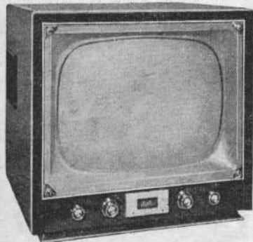
RIBET-DESJARDINS - Téléviseur de table

Croix du Sud 57M17. Tube de 43 cm aluminisé (MW43-22R07). Multicanal. Rotacteur 6 positions, équipé suivant région, standard français, sarrois, monégasque, belge ou luxembourgeois 819 lignes. 15 lampes + 2 germaniums et redresseur sec. Bande passante 9,5 Mc/s. Sensibilité 100 à 200 \mu V (*). Anti-parasites image réglable. HP 17 cm. Alternatif 6 prises 110/240 V, 50 c/s, 125 VA. Ebénisterie foncée, encadrement plastique, décor métal oxydé bronze. H 470 - L 500 - P 480 mm. Prix T.L. en sus 127.433. Prix T.T.C. 131.039 Sagittaire 57M21. Tube de 54 cm aluminisé angle 90° (21ATP4B). Concentration électrostatique automatique. HP 16-24 cm. 145 VA. Autres caractéristiques identiques. Présentation du Centaure 57L21: H 567 - L 633 - P 577 mm. Prix T.L. en sus 165.108. Prix T.T.C. 169.781 Lampes : 6BQ7A, 6U8, ECF80, 4-EF80, ECL80, ECL82, EL84, EL81F (ou EL36, 54 cm), ECC82, EY81F, EY86, EBF80, OA70, OA71, redresseur Siemens E250C300.