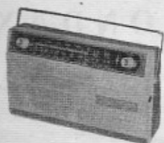
IMAGE PARLANTE - Poste à transistors

Transistors : AC126, AC132, 2-SFT319, SFT320, SFT523.