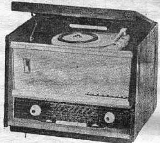
SCHNEIDER - Coffret radio-phono

de n'importe quel point de la gamme OC). 2 HP : 16-24 cm ticonal, 10 000 gauss et statique. Correction BF spéciale en position FM. Autres caractéristiques identiques. T.T.C. port compris 520 NF Lampes : ECF82, ECH81, EBF89, 6AU6, EL84, EZ80, EM81, germaniums : 2-OA79.