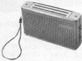
TEVEA - Poste à transistors

Teen. 6 transistors, 2 diodes, 2 gammes PO-GO. Cadre ferrite 14 cm. Puissance 0,2 W. Haut-parleur 7 cm. Prise pour écouteur ou