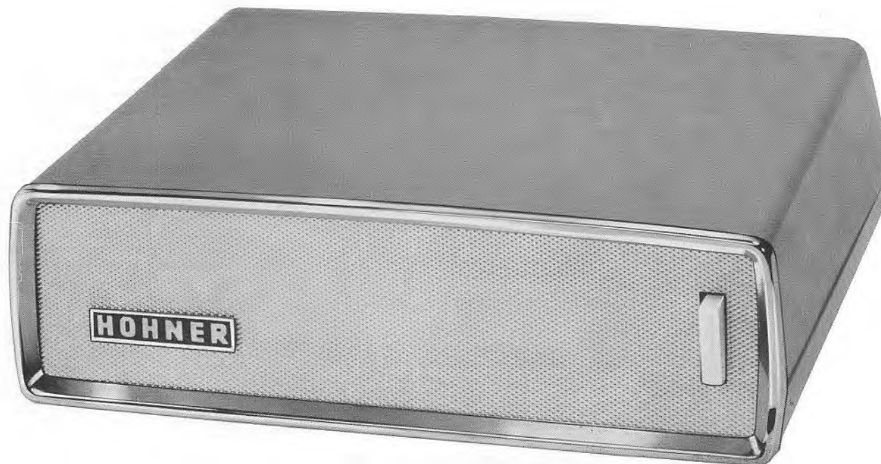
E = Empfänger