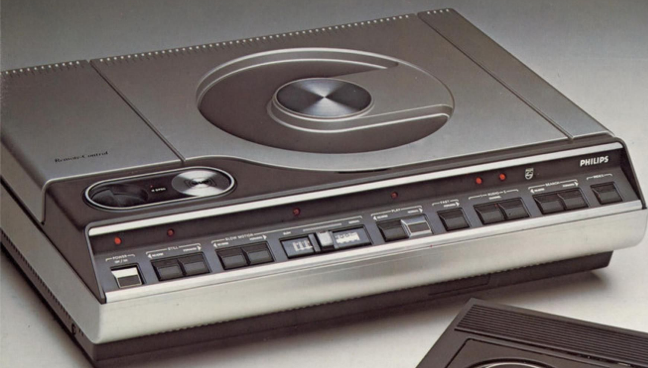
Platine VLP modèle de démonstration*

Le Compact Disc Digital Audio s'impose aujourd'hui comme le plus prestigieux système de reproduction haute fidélité jamais réalisé.