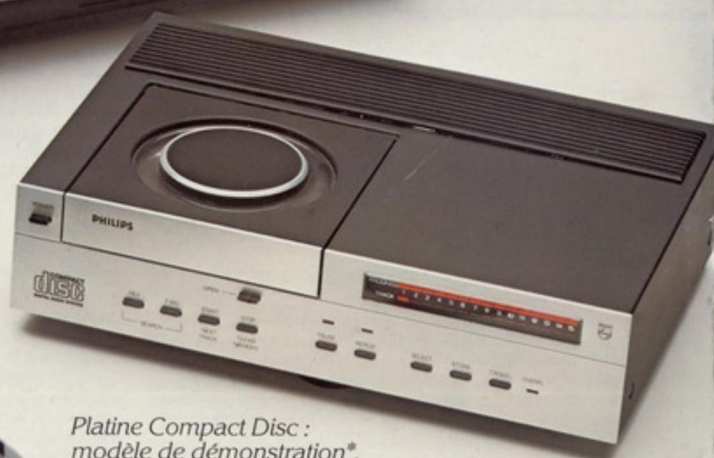
Platine Compact Disc : modèle de démonstration*.