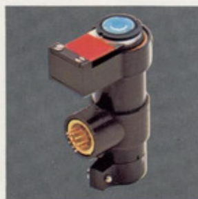
Tête de lecture optique