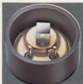
Le laser Ga Al As