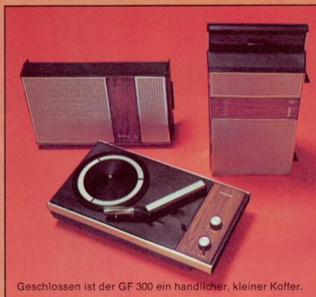
Geschlossen ist der GF 300 ein handlicher, kleiner Koffer.

Als Zubehör lieferbar: Netz-Vorschaltgerät LFD 3416.