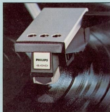
Philips SUPER M

Als Zubehör lieferbar: Magn.-dyn. HiFi-Tonabnehmersystem SUPER M 401. Entzerrer/Vorverstärker GH 905 zum Einbau durch einfache Steckverbindung.