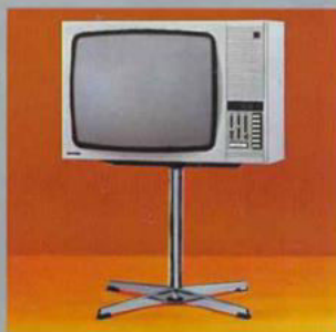
Elite 730 auf dem als Zubehör lieferbaren Chrom-Drehfuß 1

Ausführungen: Elite 530 Edelholzgehäuse nußbaumfarben, Elite 730 Edelholzgehäuse nußbaumfarben oder Schleiflack weiß. Maße ca. 73 × 49 × 27 (+ 12) cm.