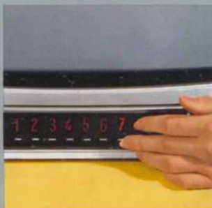
„impuls-electronic“ vollelektronische Berührungs-Programmwahl

Elektronische Leuchtziffern-Programmanzeige. Leicht gleitende elektronische Flachbahnregler für Helligkeit, Kontrast, Lautstärke. Superphon-Lautsprecher. Anschluß für Kleinhörer 203 L. Anschluß für Fernregler II nachrüstbar. Aufsteckbare Doppel-Teleskopantenne. Robustes Kunststoffgehäuse weiß oder schwarz mit versenkbarem Griff. Maße ca. 49 × 45 × 36 cm. Gewicht ca. 20 kg.