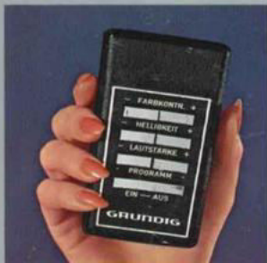
„tele-dirigent“ drahtlose Fernsteuerung

Programm-Schnellwahl ohne Umweg über nicht belegte Stationen durch GRUNDIG reset-Schaltung. Programmanzeige durch Electronic-Ziffernröhre. Superfarbbild im 66 cm Superformat. Schrankwand-ideale 110°-Weitwinkel-Bildröhre. Kraftvoller Superphon-Frontlautsprecher. Edelholzgehäuse nußbaumfarben oder Schleiflack weiß. Maße ca.: Breite 76 cm, Höhe 52 cm, Gesamttiefe 46 cm, Gehäusetiefe 41 cm. Gerätergewicht nur noch ca. 38 kg.