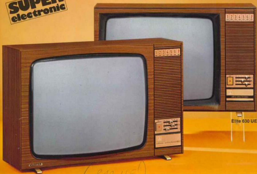
Elite 830 UE