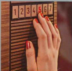
„impuls-electronic“ vollelektronische Berührungs-Programmwahl

Maße ca.: Breite 76 cm, Höhe 52 cm, Gesamt-tiefe 46 cm, Gehäusetiefe 41 cm. Gerätegewicht nur noch ca. 38 kg.