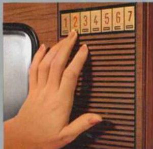
impuls-electronic™ vollelektronische Berührungs-Programmwahl

vollelektronische Programmwahl. Alles läuft reibungslos ohne Mechanik, computer-exakt, lautlos. Elektronische Leuchtziffern-Programmanzeige. Leicht gleitende elektronische Flachbahnregler für Helligkeit, Kontrast, Lautstärke. Superphon-Frontlautsprecher. Anschluß für Fernregler II nachrüstbar. Edelholzgehäuse nußbaumfarben oder Schleiflack weiß. Maße ca. 72 × 49 × 27 (+ 12) cm.