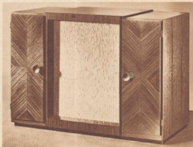
SIEMENS KAMMERMUSIK-SCHATULLE SUPER 85

W bei Barzahlung . . . RM 235,75 GW bei Barzahlung . . . *RM 259,— Anzahlung . . . . . RM 47,15 Anzahlung . . . . . RM 51,80 u.z.B.10 Raten monatl. RM 20,75 u.z.B.10 Raten monatl. RM 22,80