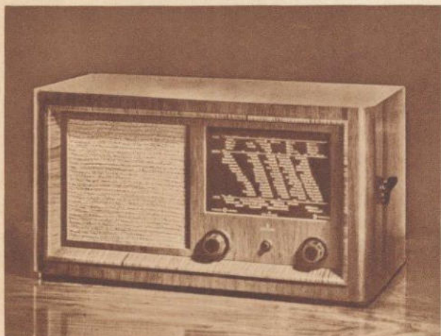
SIEMENS SUPER 83 KENNWORT: JUPITER

W bei Barzahlung . . . RM 214,75 GW bei Barzahlung . . . *RM 234,— Anzahlung . . . . . RM 42,95 Anzahlung . . . . . RM 46,80 u.z.B.10 Raten monatl. RM 18,90 u.z.B.10 Raten monatl. RM 20,60