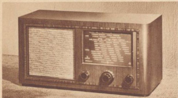
SIEMENS 81 KENNWORT: MERKUR